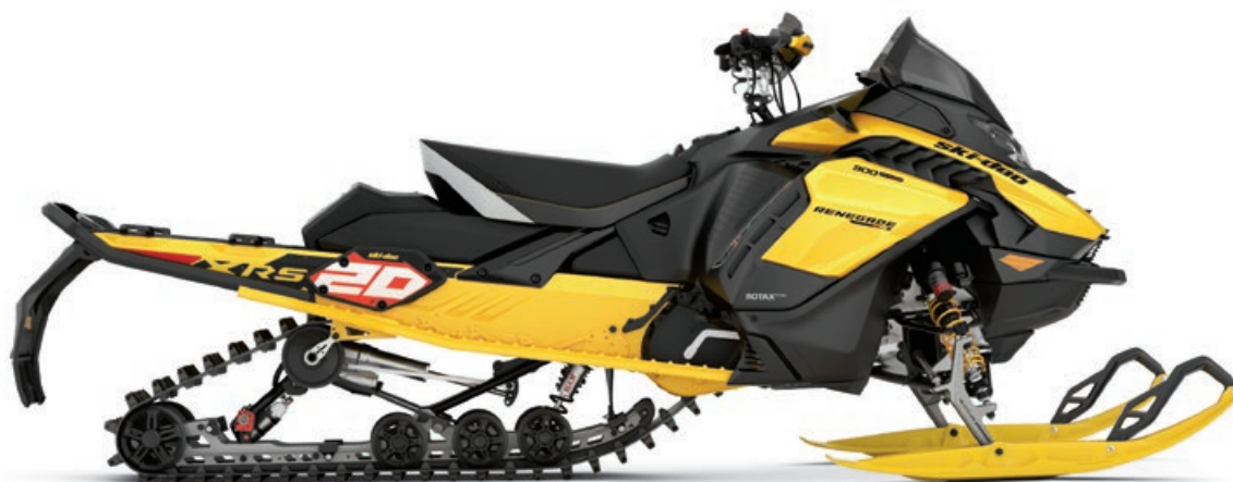
RENEGADE X-RS 900 ACE TURBO R MONTRÉ

Amortisseurs d'une capacité et d'une durabilité exceptionnelles pour un meilleur contrôle dans les conditions les plus difficiles. Équipé du système Easy-Adjust pour régler facilement la compression et le rebond.