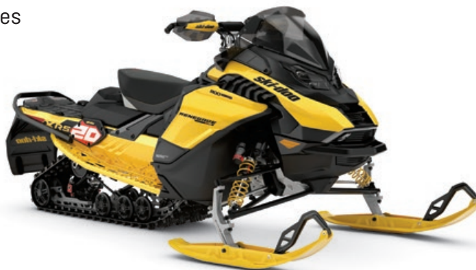
RENEGADE X-RS 900 ACE TURBO R MONTRE