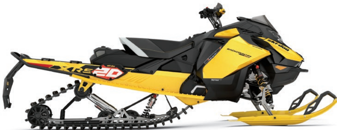
BACKCOUNTRY X-RS 146 850 E-TEC TURBO R MONTRE

La combinaison entre l'écartement des skis de 43 pouces et la suspension avant RAS RX améliore la stabilité lors d'une courbe en sentier tout en gardant une bonne traction et flottaison dans la neige profonde.