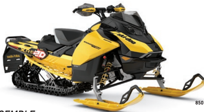
BACKCOUNTRY X-RS 146 850 E-TEC TURBO R MONTRE