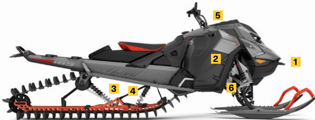
SUMMIT X 154 850 E-TEC TURBO R MONTRÉ

Une suspension légère avec une réaction de suspension rapide qui met de l'avant l'agilité et le facteur plaisir de cette performante motoneige.