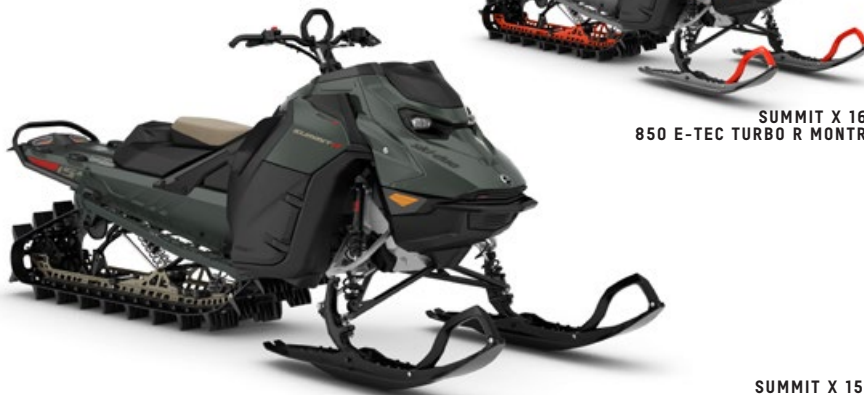
SUMMIT X 165 850 E-TEC TURBO R MONTRE