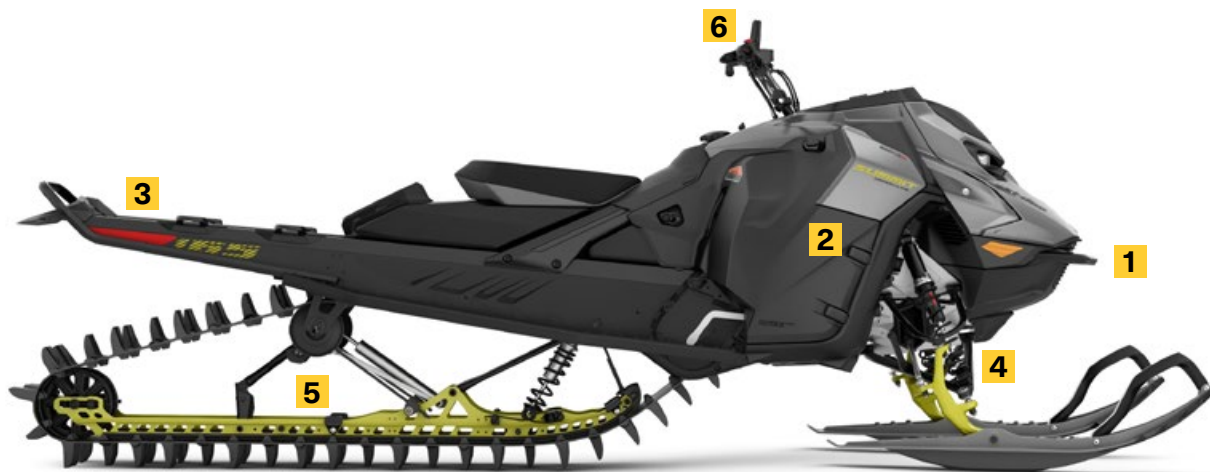
SUMMIT ADRENALINE AVEC ENSEMBLE EDGE 154 850 E-TEC TURBO R MONTRÉ

Tunnel court sans garde-neige pour une plus grande capacité en neige profonde et une réduction de poids. Aile légère à l'arrière avec points d'attache LinQ.