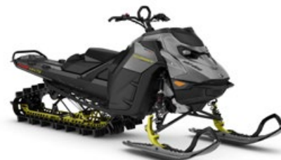
SUMMIT ADRENALINE AVEC ENSEMBLE EDGE 165 850 E-TEC TURBO R MONTRÉ