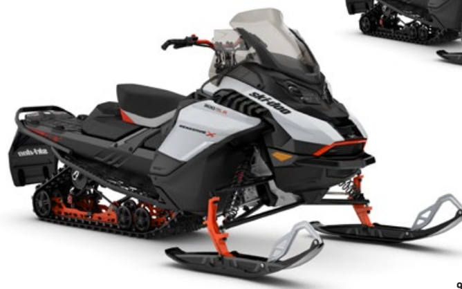
RENEGADE X 900 ACE TURBO MONTRE

Des caractéristiques de haute performance et de haute technologie pour les motoneigistes les plus exigeants.