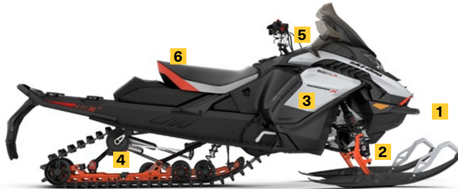
RENEGADE X 900 ACE TURBO R MONTRÉ

Maintenant le plus puissant moteur 4 temps offert. Accélération instantanées et vitesse de pointe impressionnantes grâce à des injecteurs de carburant plus gros, à plus de puissance et des systèmes d'admission et d'échappement optimisés. Le nouvel accélérateur iTC MC à commande électronique correspond mieux au profil des motoneigistes de performance, sans compter qu'il offre trois modes de conduite.