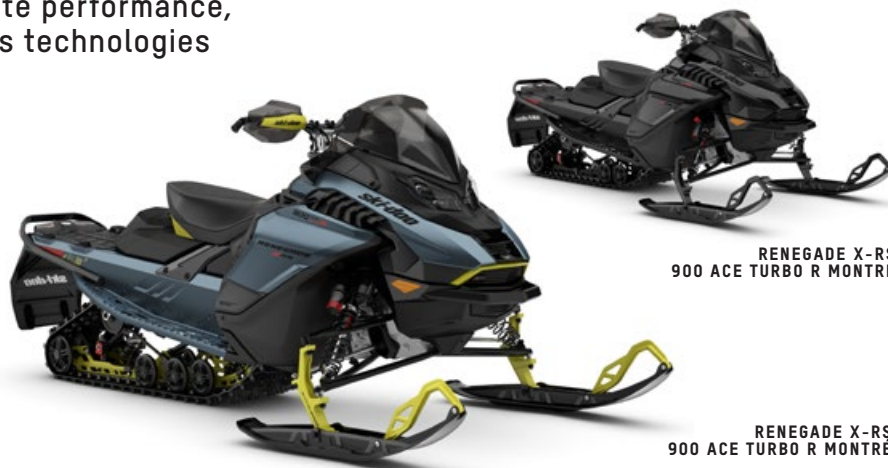
RENEGADE X-RS 900 ACE TURBO R MONTRE

Une machine audacieuse de haute performance, avec des caractéristiques et des technologies à la fine pointe de l'industrie.