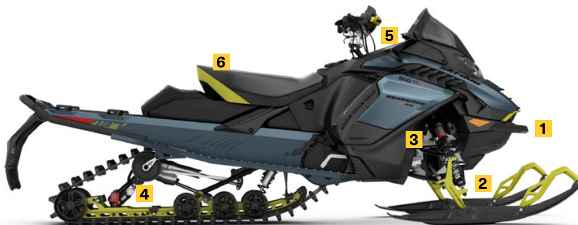
RENEGADE X-RS 900 ACE TURBO R MONTRÉ

Amortisseurs d'une capacité et d'une durabilité exceptionnelles pour un meilleur contrôle dans les conditions les plus difficiles. Équipé du système Easy-Adjust pour régler facilement la compression et le rebond.