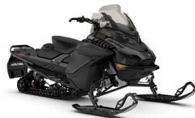
RENEGADE ADRENALINE 900 ACE MONTRE