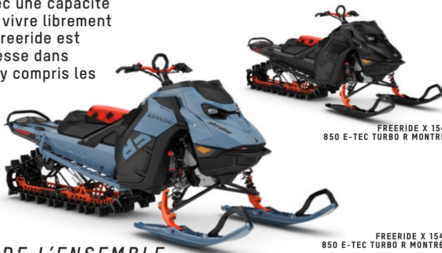
FREERIDE X 154 850 E-TEC TURBO R MONTRÉ