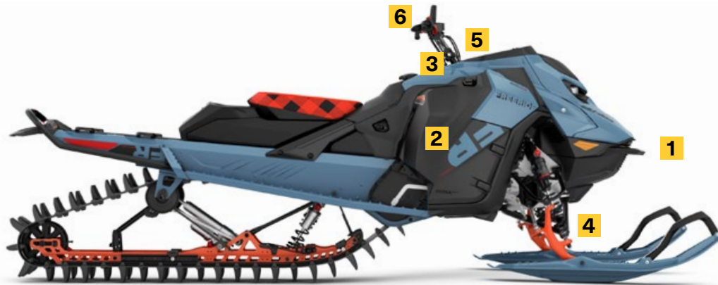
FREERIDE X 154 850 E-TEC TURBO R MONTRÉ

La précision de la direction sera améliorée à vitesse élevée pour une conduite stable et prévisible dans tous types de neige.