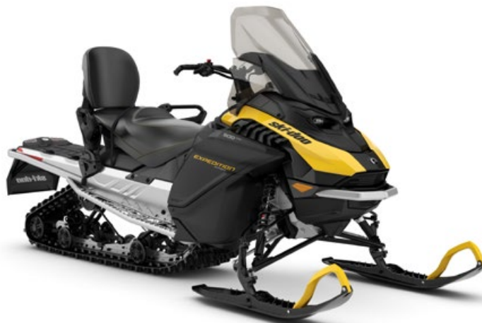
EXPEDITION SPORT 900 ACE MONTRE

Châssis ultramaniable de sentier et hors-piste, avec un vaste éventail de caractéristiques sport-utilitaires et pour utilisation à deux.