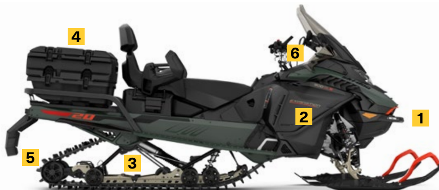
EXPEDITION SE 900 ACE TURBO R MONTRÉ

Une ergonomie de véhicule parfaitement équilibrée permettant une versatilité sur sentier et en hors-piste avec un débattement arrière supérieur pour une expérience de conduite optimale, avec ou sans cargo.