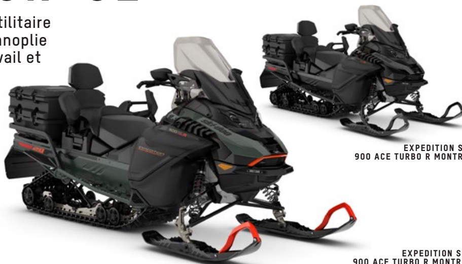
EXPEDITION SE 900 ACE TURBO R MONTRE