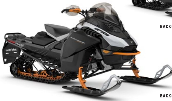
BACKCOUNTRY ADRENALINE 146 850 E-TEC MONTRÉ