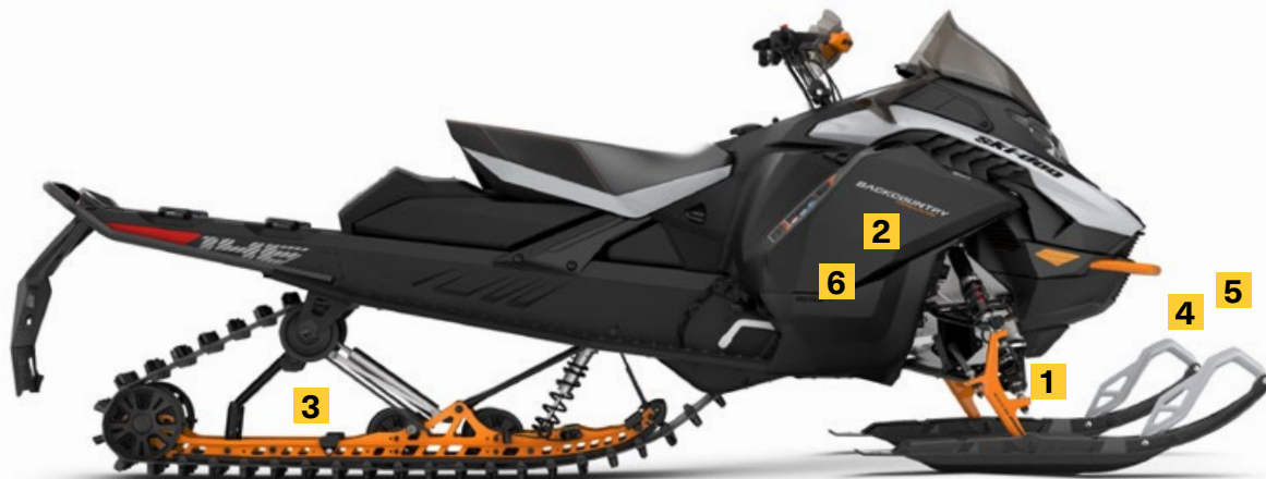
BACKCOUNTRY ADRENALINE 146 850 E-TEC MONTRÉ

La conception plus légère est mieux équilibrée pour les performances sur et hors-piste. Dispose de plus de transfert de charge pour un facteur de plaisir accru, plus de débattement pour plus de confort et d'absorption de choc.