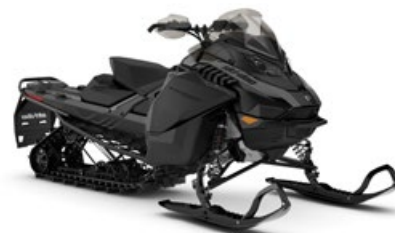
BACKCOUNTRY ADRENALINE 146 600R E-TEC MONTRÉ

Modèle hybride multisegments entièrement équipé pour passer autant de temps hors-piste qu'en sentiers.