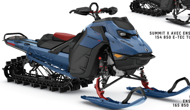
SUMMIT X AVEC ENSEMBLE EXPERT 165 850 E-TEC TURBO R MONTRE