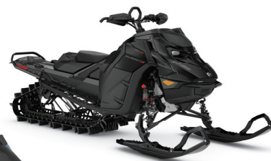
SUMMIT X AVEC ENSEMBLE EXPERT 154 850 E-TEC TURBO R MONTRE

La motoneige de hors-piste ultime pour la précision et la prévisibilité équipée de caractéristiques dédiées aux terrains les plus techniques.