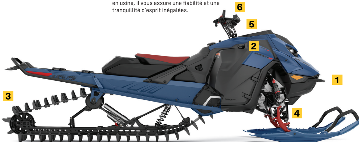
SUMMIT X AVEC ENSEMBLE EXPERT 165 850 E-TEC TURBO R MONTRE

Cette chenille repensée de 16 pouces au poids réduit est unique à l'ensemble Expert. Son rebord plus rigide se combine à la tMotion XT pour assurer une rigidité accrue à l'arrière.