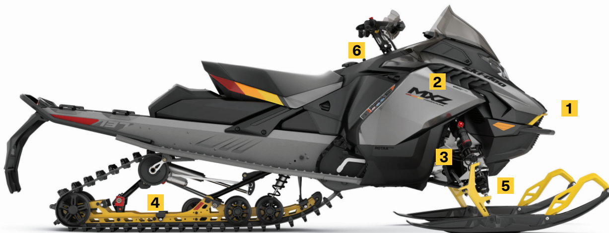
MXZ ADRENALINE AVEC ENSEMBLE BLIZZARD 850 E-TEC MONTRE

Amortisseurs avant et arrière KYB Pro 36 Easy-Adjust avec réglage de la vitesse de compression. Amortisseurs HPG Plus à l'avant et au centre. Quatre amortisseurs démontables en aluminium.