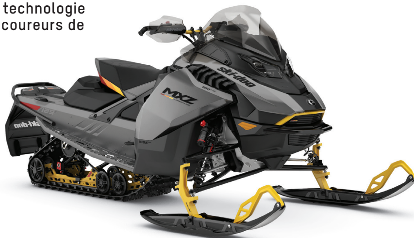
MXZ ADRENALINE AVEC ENSEMBLE BLIZZARD 850 E-TEC MONTRÉ

Caractéristiques de haute technologie et ADN de course pour les coureurs de sentiers endurcis.