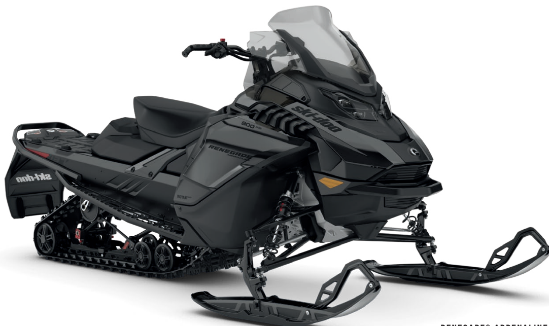
RENEGADE® ADRENALINE 900 ACE VIST