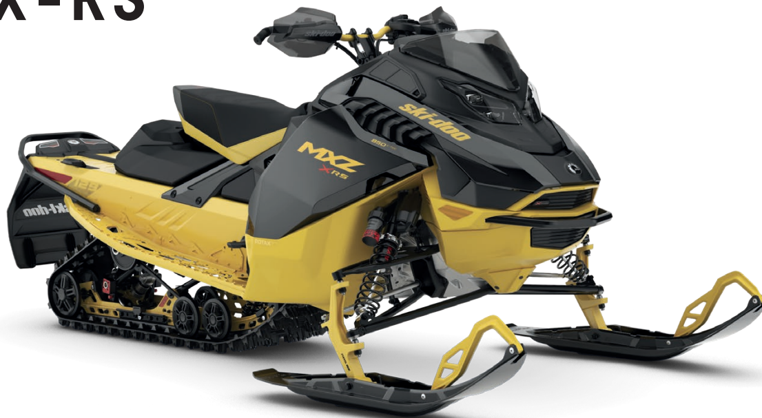
MXZ X-RS 850 E-TEC VIST