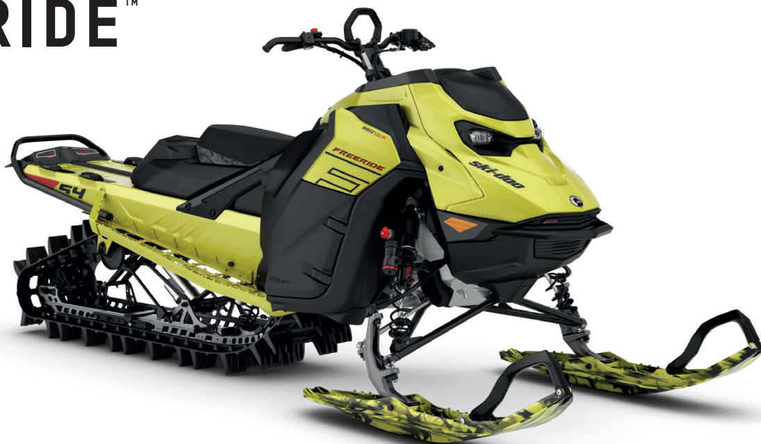
FREERIDE 154 850 E-TEC TURBO R VIST