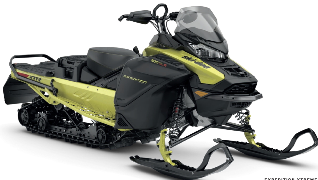
EXPEDITION XTREME 900 ACE TURBO R VIST