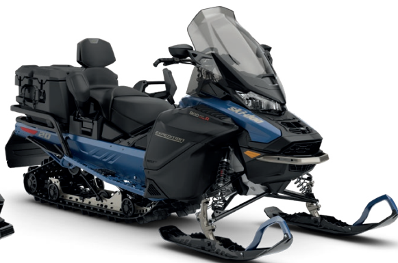
EXPEDITION SE 900 ACE TURBO R VIST