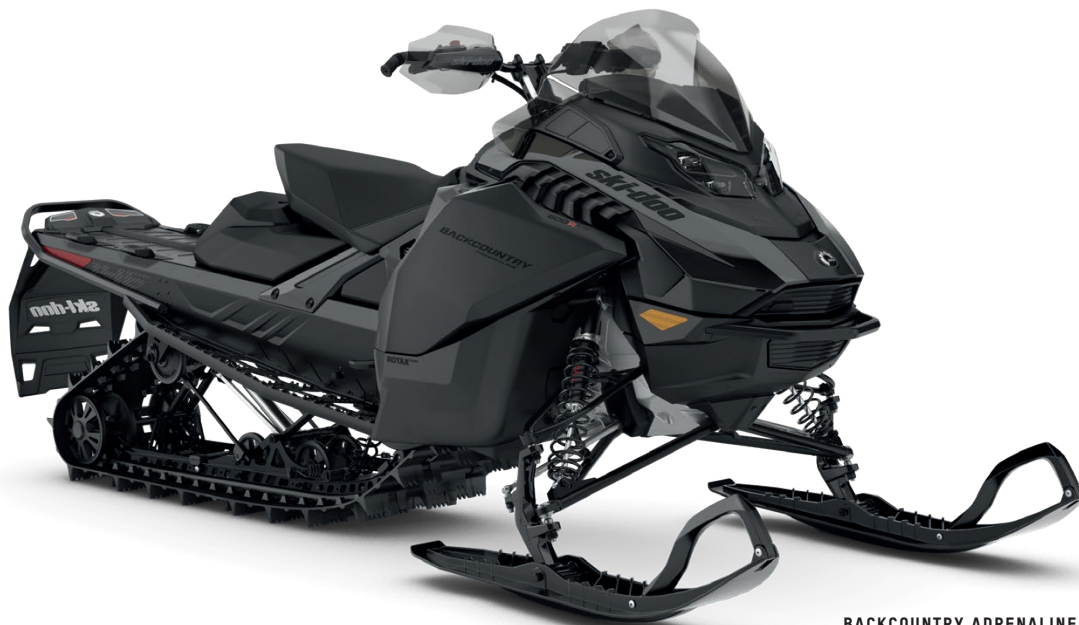
BACKCOUNTRY ADRENALINE 600R E-TEC VIST