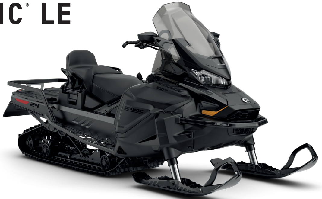
SKANDIC LE 900 ACE KUVASSA