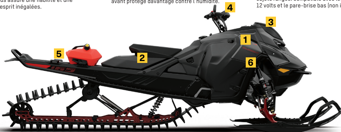
SUMMIT ADRENALINE AVEC ENSEMBLE EDGE 165 850 E-TEC TURBO R MONTRE

L'extension de boîte à gants souple ajoute un espace de rangement facilement accessible. La construction semi-rigide est robuste et résistante à l'eau tout en offrant 30 % de capacité supplémentaire, dont un compartiment intérieur séparé pour le téléphone portable. L'intérieur jaune vif facilite le repérage des objets et offre une meilleure protection pour les objets rangés. Compatible avec les prises USB et 12 volts et le pare-brise bas (non inclus).