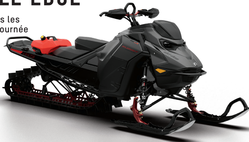
SUMMIT ADRENALINE AVEC ENSEMBLE EDGE 165 850 E-TEC TURBO R MONTRE