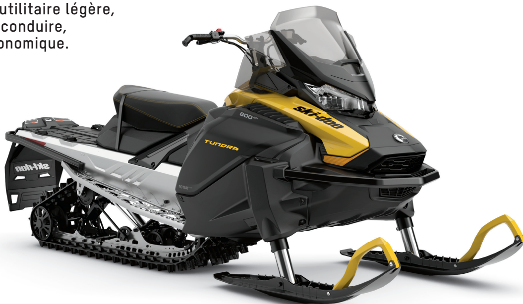
TUNDRA SPORT 600 EFI MONTRE

Motoneige utilitaire légère, agréable à conduire, agile et économique.