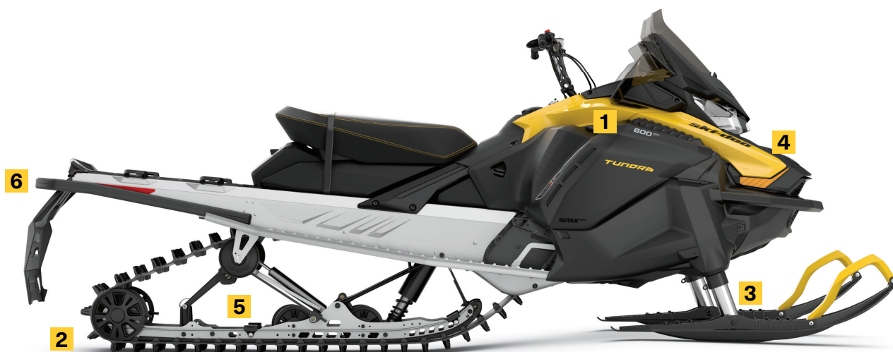
TUNDRA SPORT 600 EFI MONTRE

Suspension avant télescopique, exclusive dans l'industrie, permettant à la large coque de procurer une flottaison exceptionnelle dans la neige profonde.