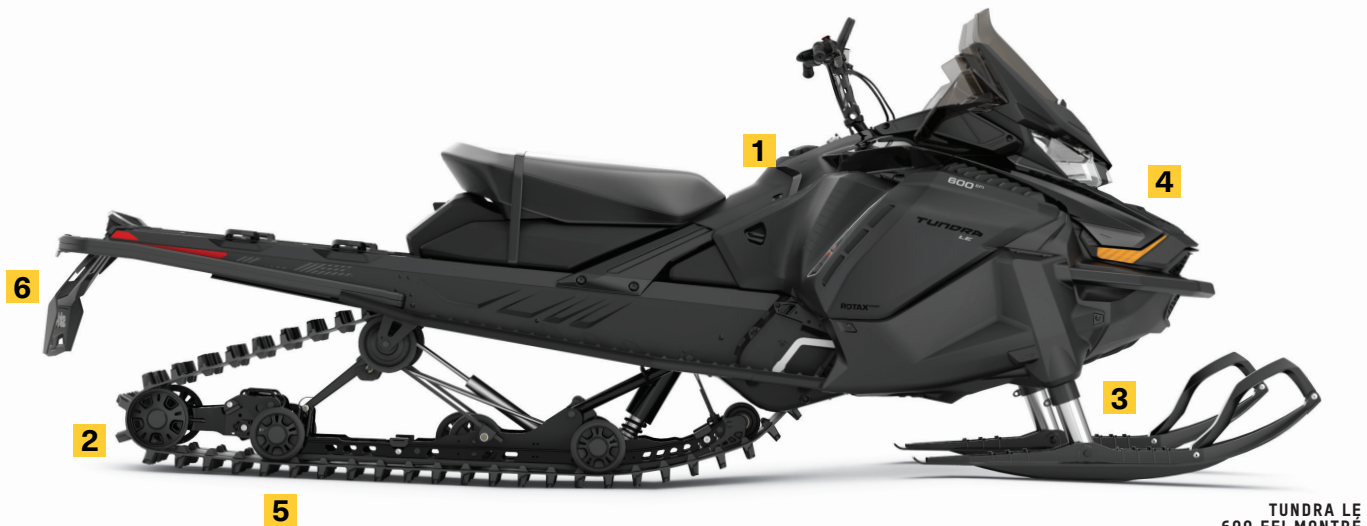
TUNDRA LE 600 EFI MONTRE

Suspension avant télescopique, exclusive dans l'industrie, permettant à la large coque de procurer une flottaison exceptionnelle dans la neige profonde.