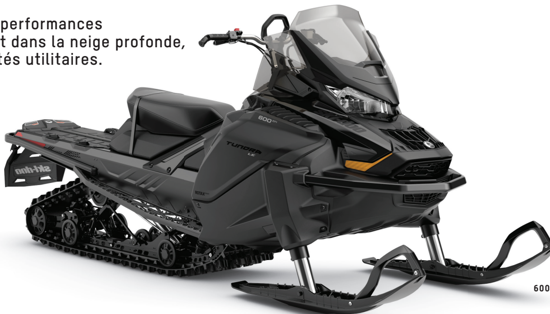
TUNDRA LE 600 EFI MONTRÉ

Excellentes performances hors-piste et dans la neige profonde, avec capacités utilitaires.