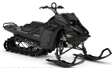
SUMMIT ADRENALINE AVEC ENSEMBLE EDGE 154 850 E-TEC MONTRÉ

Cet ensemble haut de gamme est offert en saison, entièrement équipé de caractéristiques techniques éprouvées.