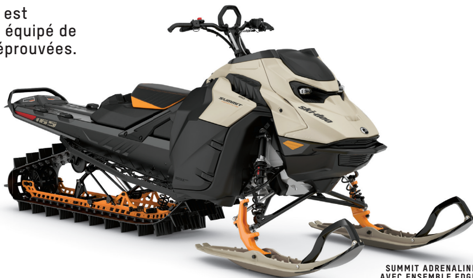
SUMMIT ADRENALINE AVEC ENSEMBLE EDGE 165 850 E-TEC MONTRÉ