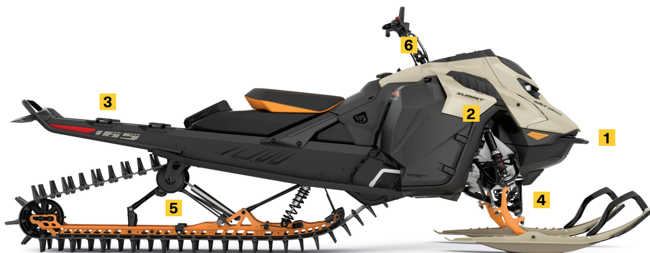
SUMMIT ADRENALINE AVEC ENSEMBLE EDGE 165 850 E-TEC MONTRE

Tunnel court sans garde-neige pour une plus grande capacité en neige profonde et une réduction de poids. Garde-neige léger à l'arrière avec points d'attache LinQ®.