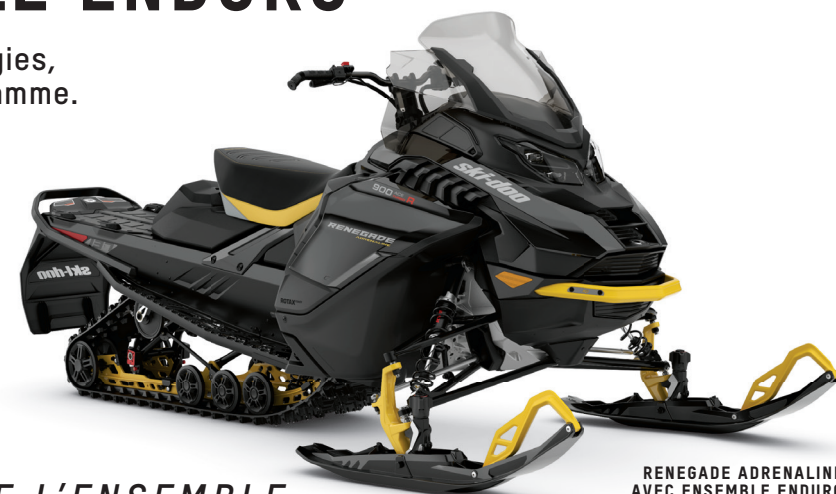
RENEGADE ADRENALINE AVEC ENSEMBLE ENDURO 900 ACE TURBO R MONTRE