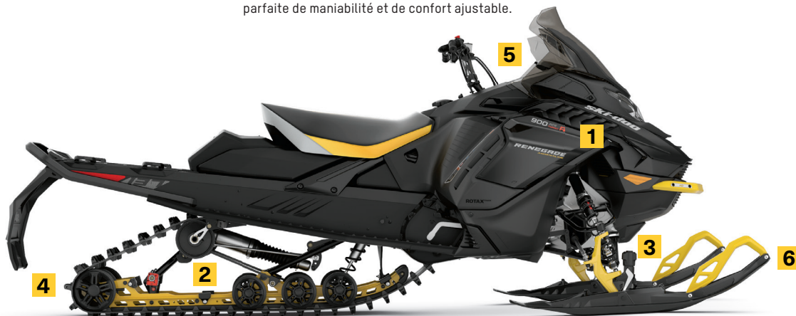
RENEGADE ADRENALINE AVEC ENSEMBLE ENDURO 900 ACE TURBO R MONTRE

Stabilité dans les virages et maniabilité de précision dans toutes les conditions. Conçue avec la suspension arrière rMotion X pour redéfinir la norme de performance des châssis de motoneiges de sentiers. Stabilité, capacités et confort accrus grâce à un écartement des skis plus large et ajustable, et à un débattement de suspension de +10 mm.