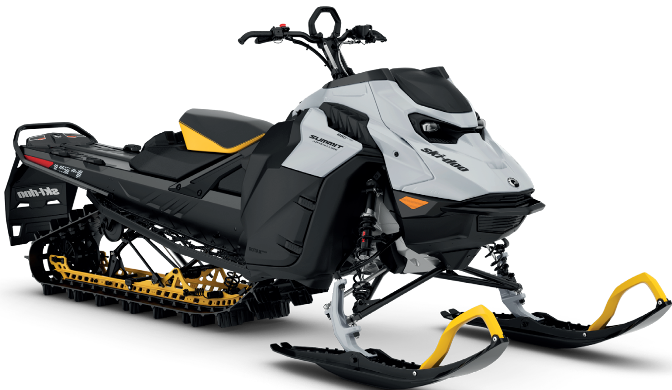
SUMMIT ADRENALINE 154 850 E-TEC VISAS