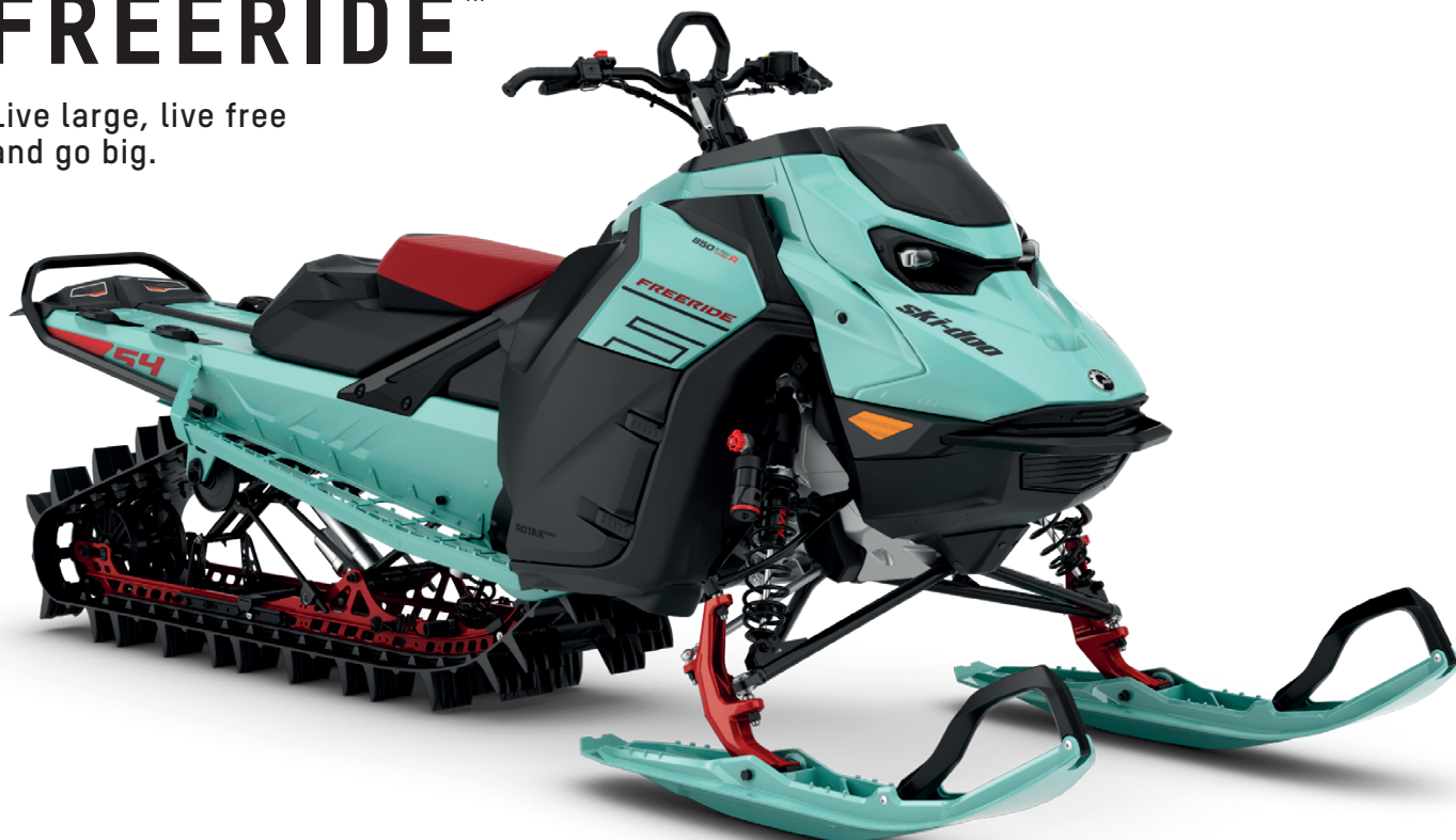
FREERIDE 154 850 E-TEC TURBO R VISAS