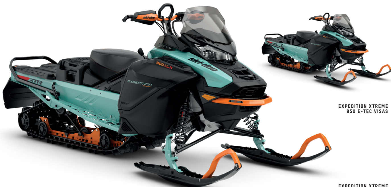
EXPEDITION XTREME 850 E-TEC VISAS