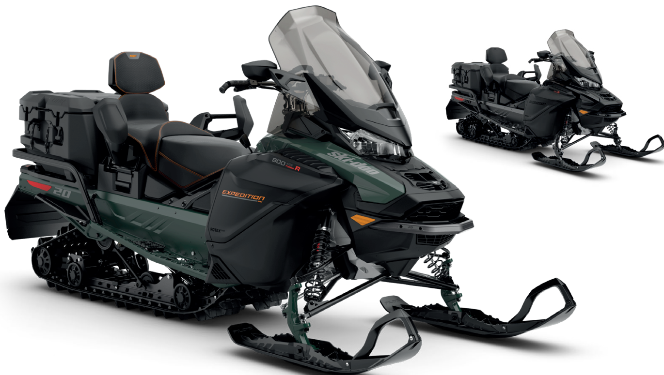
EXPEDITION SE 900 ACE TURBO R VISAS