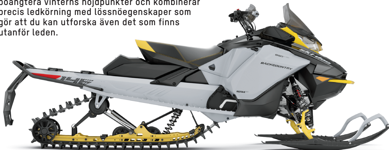
BACKCOUNTRY 146 600R E-TEC VISAS

2023-års Ski-Doo Backcountry är idealisk för att poängtera vinterns höjdpunkter och kombinerar precis ledkörning med lössnöegenskaper som gör att du kan utforska även det som finns utanför leden.