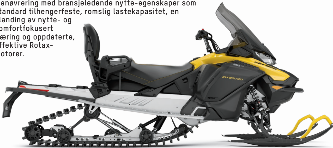
EXPEDITION SPORT 900 ACE VIST

Expedition Sport kombinerer smidig og presis manøvrering med bransjeledende nytte-egenskaper som standard tilhengerfeste, romslig lastekapasitet, en blanding av nytte- og komfortfokusert fjæring og oppdaterte, effektive Rotax-motorer.