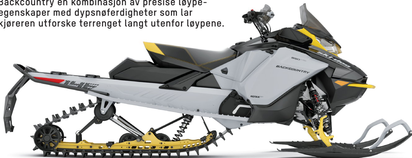
BACKCOUNTRY 146 600R E-TEC VIST

Utpekt som vinterens høydepunkt har 2023 Ski-Doo Backcountry en kombinasjon av presise løpeegenskaper med dypsnøferdigheter som lar kjøreren utforske terrenget langt utenfor løypene.