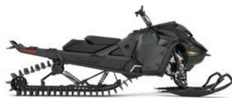
SUMMIT X 154 850 E-TEC MONTRÉ

Montées plus longues, sous-bois plus serrés et poudreuse plus profonde.