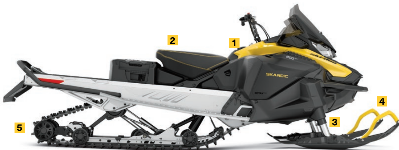
SKANDIC SPORT 600 EFI MONTRE

Suspension avant télescopique, exclusive dans l'industrie, permettant à la large coque de procurer une flottaison exceptionnelle dans la neige profonde.