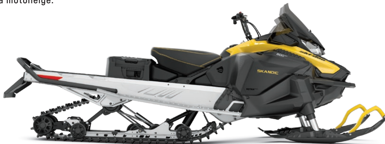
SKANDIC SPORT 600 EFI MONTRE

Le véhicule utilitaire au meilleur rapport qualité-prix de l'industrie de la motoneige.