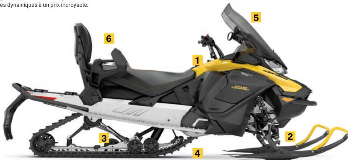
GRAND TOURING SPORT 900 ACE MONTRE

Amortisseur à gaz haute pression KYB de haute qualité procurant des performances et une fiabilité exceptionnelles.