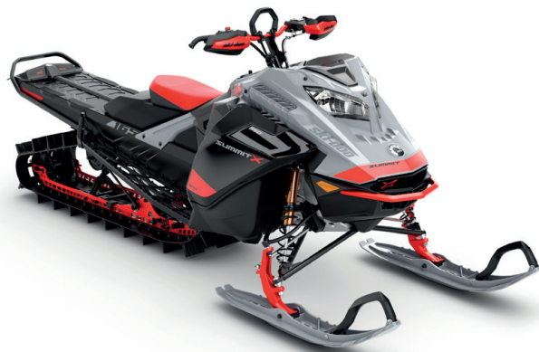
SUMMIT® X® MED EXPERT-PAKET 165 850 E-TEC® TURBO VISAS