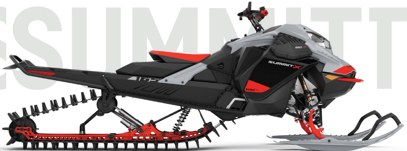
SUMMIT® X® MED EXPERT-PAKET 165 850 E-TEC® TURBO VISAS