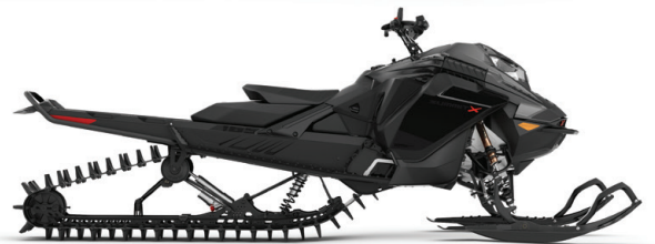
SUMMIT® X® MED EXPERT-PAKET 165 850 E-TEC® VISAS