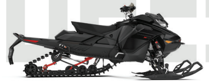
RENEGADE® X-RS® 850 E-TEC® VISAS