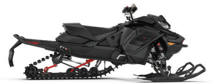
RENEGADE® X-RS® 900 ACE™ TURBO VISAS