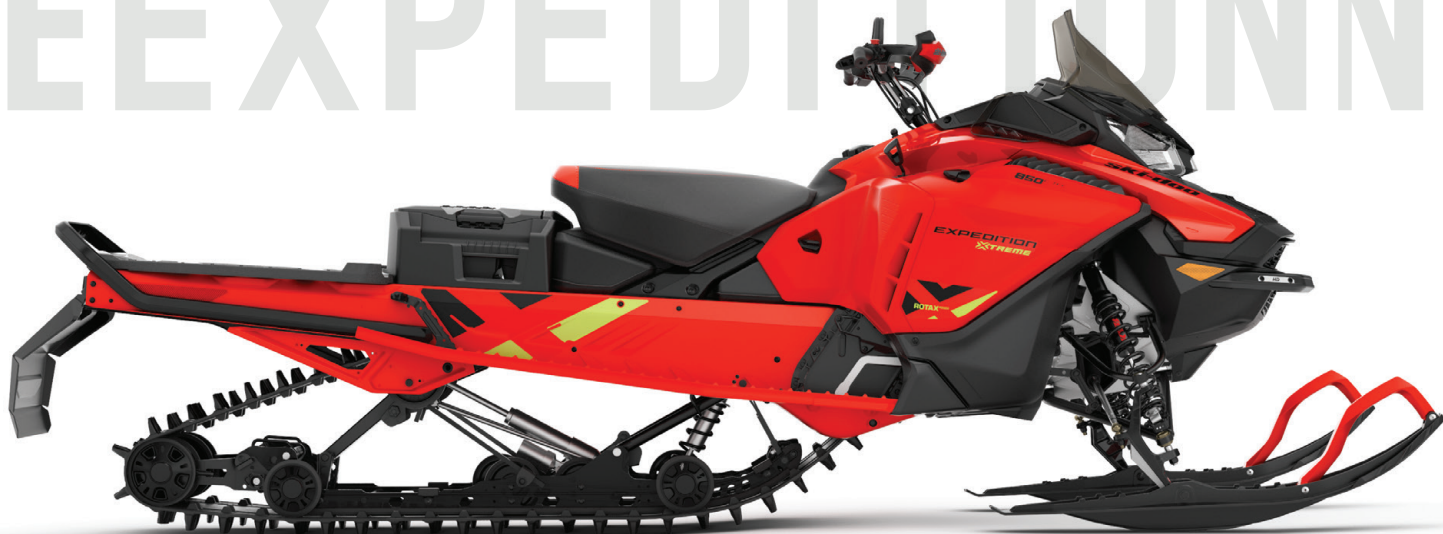
EXPEDITION® XTREME 850 E-TEC VISAS