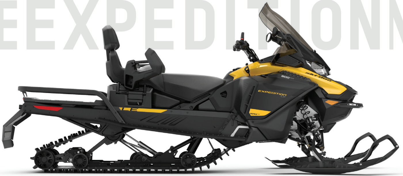
EXPEDITION® LE 900 ACE™ VISAS