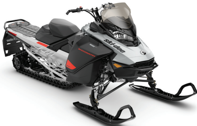
BACKCOUNTRY ™ SPORT VISAS