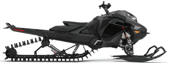
SUMMIT® X® MED EKSPERTPAKKE 165 850 E-TEC® TURBO VIST