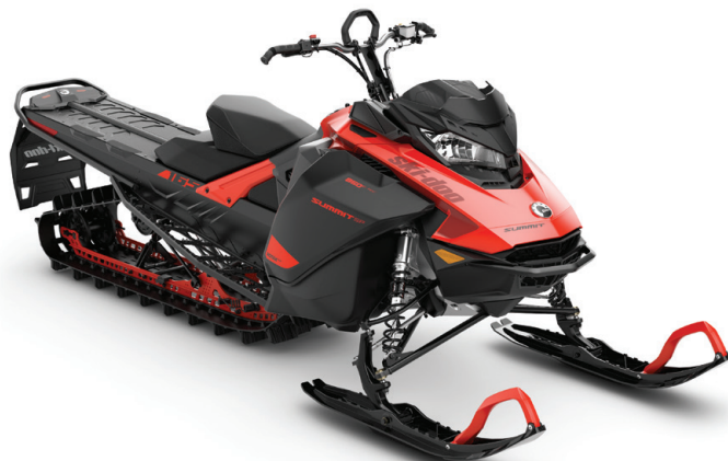
SUMMIT® SP 175 850 E-TEC® VIST