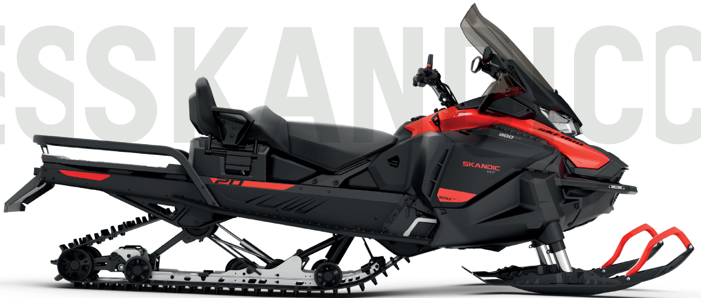
SKANDIC® WT 900 ACE™ VIST