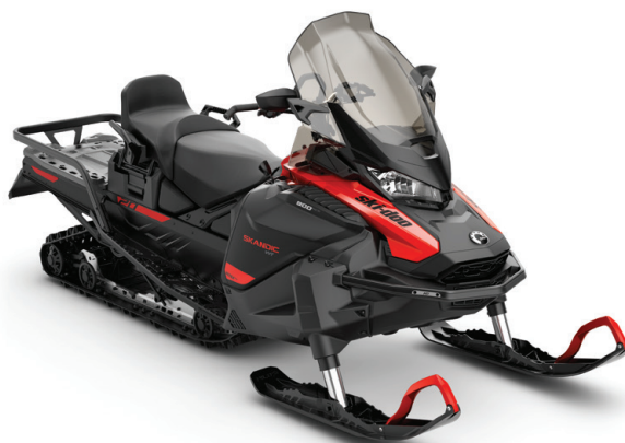
SKANDIC® WT 900 ACE™ VIST