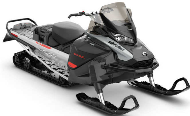
SKANDIC® SPORT 600 EFI VIST