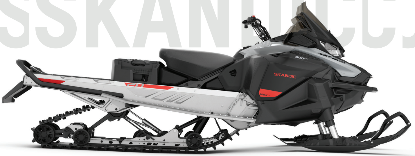
SKANDIC® SPORT 600 EFI VIST