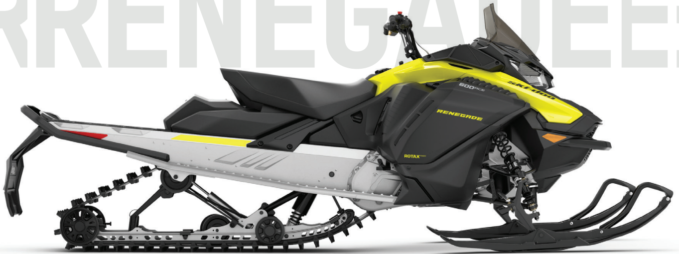
RENEGADE® WT 600 ACE™ VIST