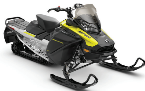
RENEGADE® WT 600 ACE™ VIST