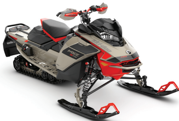
MXZ® X-RS® 850 E-TEC® VIST