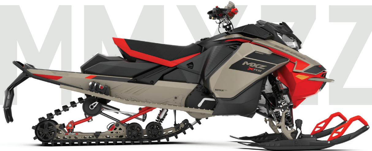
MXZ® X-RS® 850 E-TEC® VIST