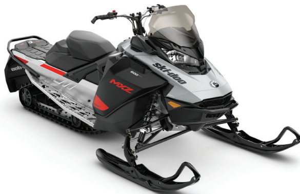
MXZ® SPORT VIST