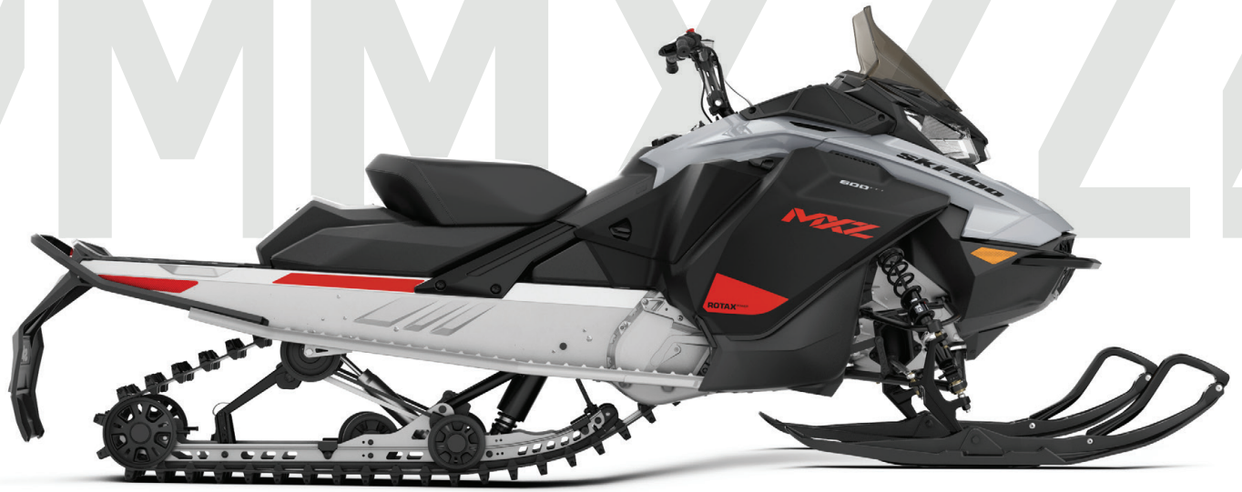
MXZ ® SPORT VIST