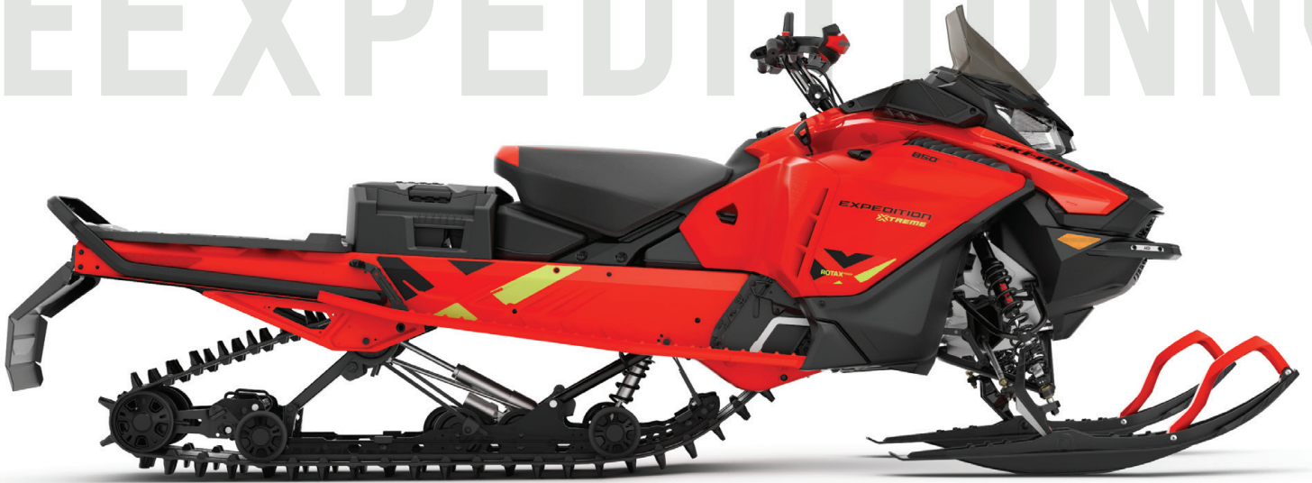
EXPEDITION® XTREME 850 E-TEC VIST