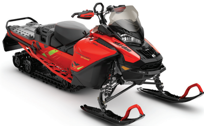
EXPEDITION® XTREME 850 E-TEC VIST