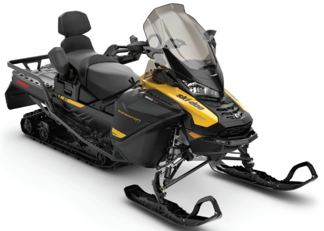
EXPEDITION® LE 900 ACE™ TURBO VIST