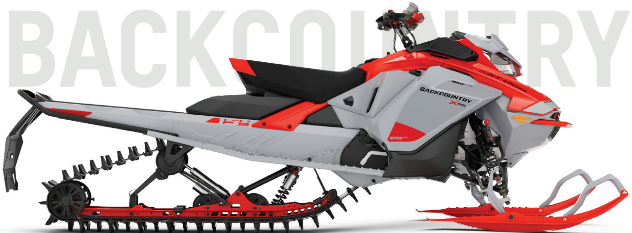
BACKCOUNTRY™ X-RS® 154 850 E-TEC® VIST [KUN VÅREN]