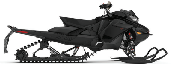
BACKCOUNTRY™ X-RS® 146 850 E-TEC® VIST